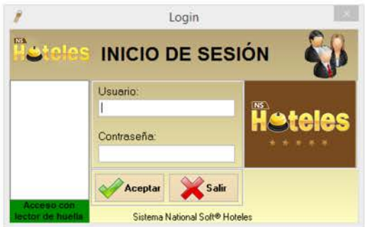
Pantalla de login